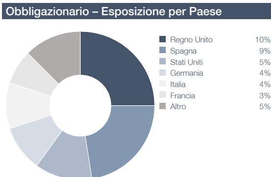
Il grafico sopra riportato rappresenta l'esposizione per paese delle obbligazioni detenute dal Fondo.